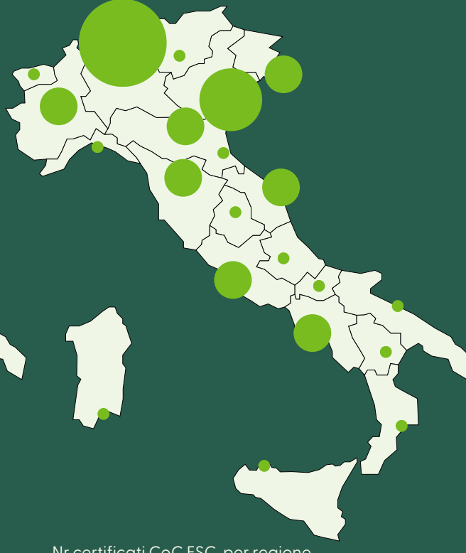
Nr certificati CoC FSC, per regione